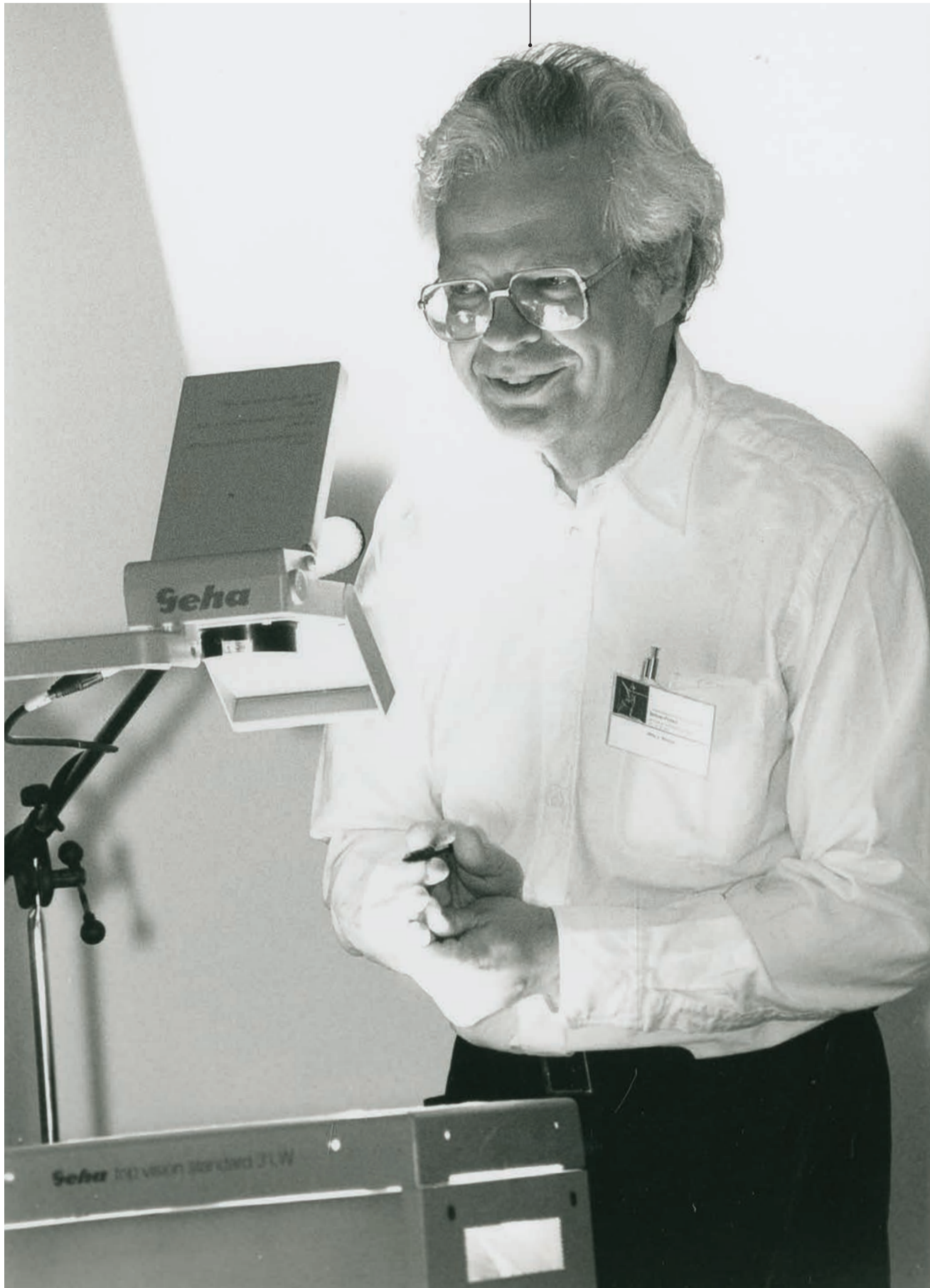
Signatur BHK/07/3 Datierung 27. Juni 1996 Ort Mensa am Park Titel Eröffnungsveranstaltung