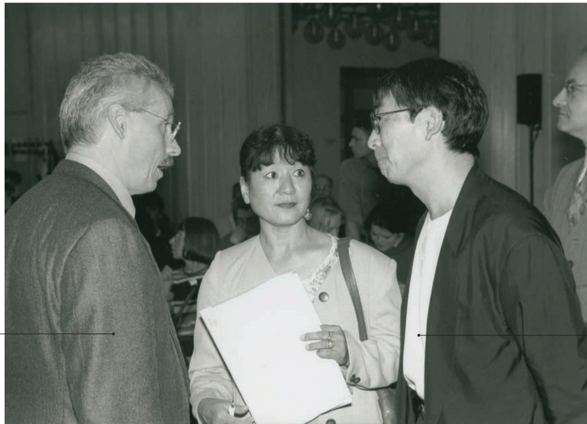
Signatur BHK/07/4 Datierung Juni 1996 Ort Mensa am Park Titel Pause