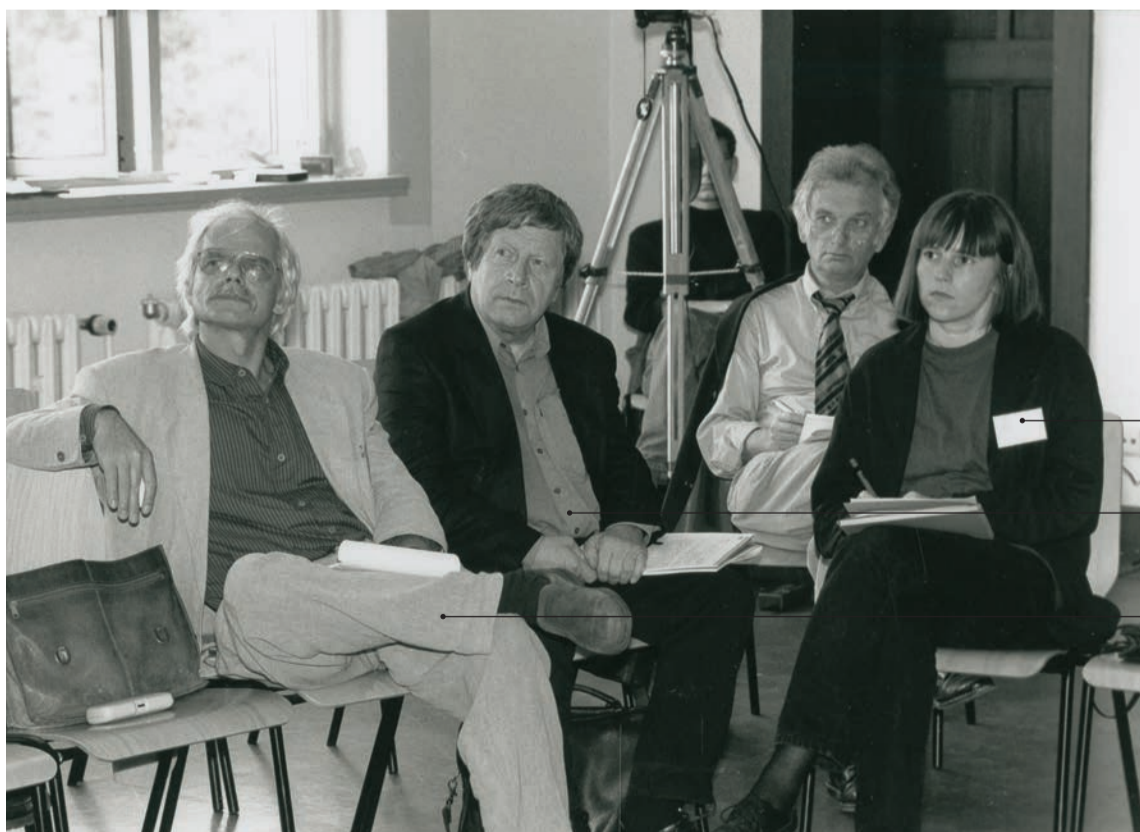
Signatur BHK/07/10 Datierung 29. Juni 1996 Ort Hauptgebäude Titel Workshop I