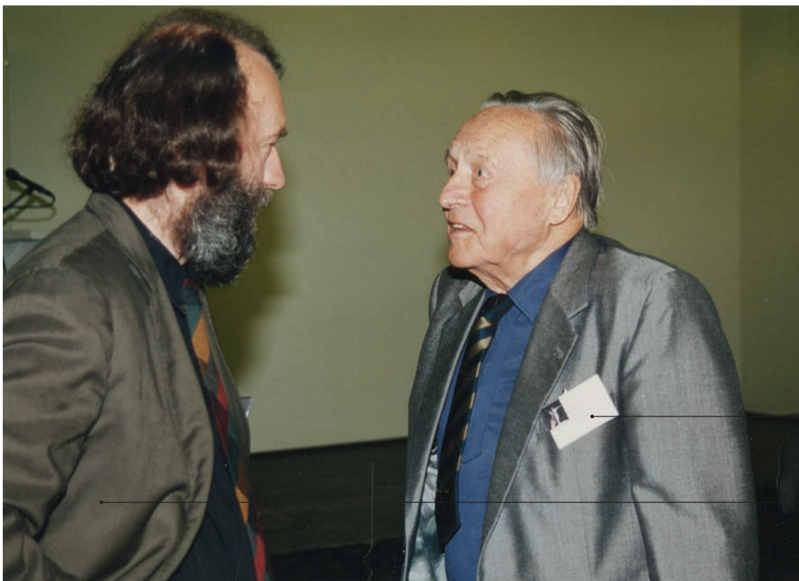
Signatur BHK/07/6 Datierung Juni 1996 Ort Hauptgebäude Titel Pause