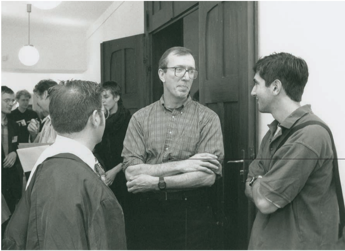
Signatur BHK/07/5 Datierung Juni 1996 Ort Hauptgebäude Titel Pause