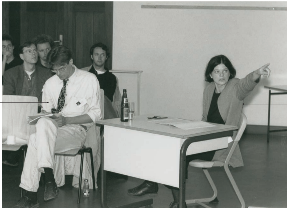
Signatur BHK/07/9 Datierung 29. Juni 1996 Ort Hauptgebäude Titel Workshop I