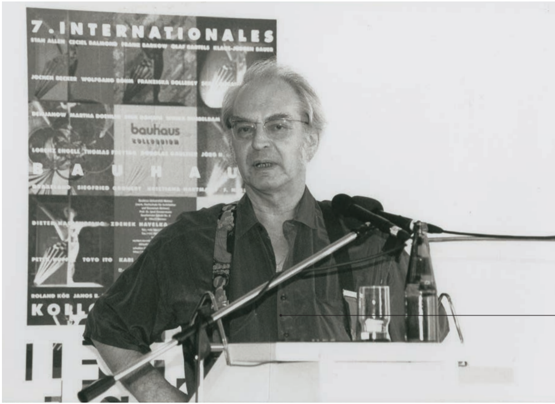
Signatur BHK/07/8 Datierung 28. Juni 1996 Ort Mensa am Park Titel Vortrag